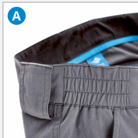
A Elastischer Hosenbund für besten Komfort

Die ergonomische Form der Hose passt sich perfekt der Liegeposition des Segelfluggpiloten an. Die Hosenbeine sind gegenüber einer normalen Hose um einige Zentimeter länger, damit die Knöchel abgedeckt und vor Kälte oder Sonnenstrahlen bestens geschützt sind. Die Kniepartien sind anatomisch geformt und garantieren einen optimalen Sitz der Hose.