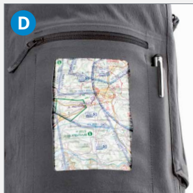
D Platz für Notizen, Checklisten und Flugkarten