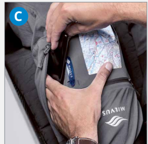
C Schneller und direkter Zugriff zu deinen Utensilien