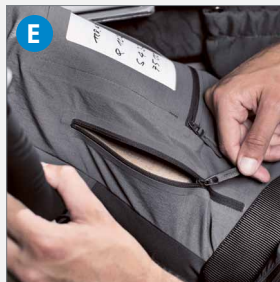
E Lüftung für optimales Körperklima an heißen Tagen