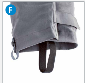
F Extra lange Hosenbeine und winddichter Abschluss

«Bekleidung für den anspruchsvollen Piloten»